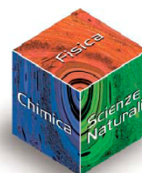
Piano ISS – Mantova